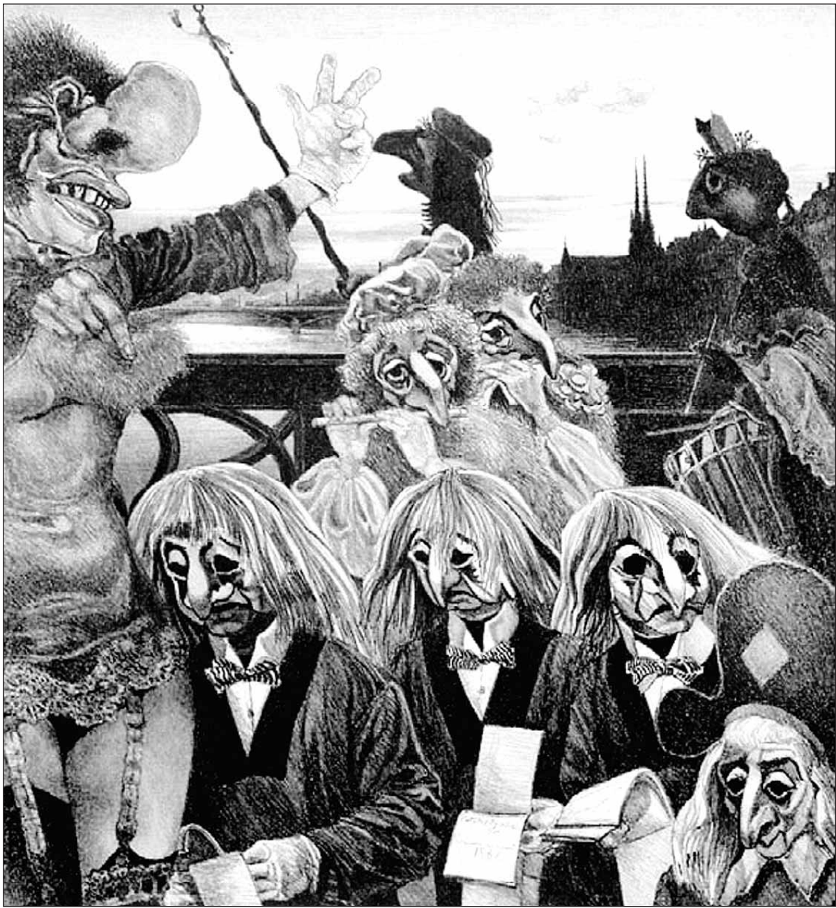
Der Mittelteil des Triptychons »Basler Fasnacht«: | depressiv. Den Bereich Naturzerstörung hat Welski Angesichts der Naturkatastrophen wirken die Narren | lange vor den Grünen thematisiert.