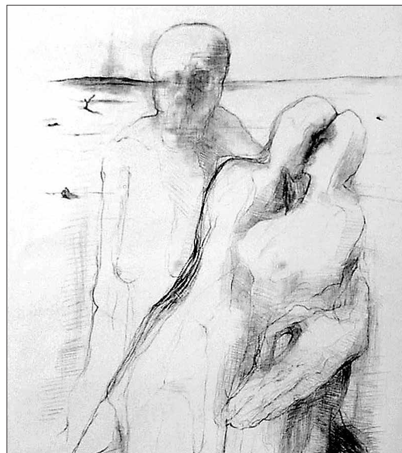
Schutzlose Körper, die den Eindruck machen, als wollten sie sich verstecken: Von Nuria Queredo stammt diese Arbeit.

Längst ist die DDR Vergangenheit, der Herforder Kunstverein indes lebt weiter.