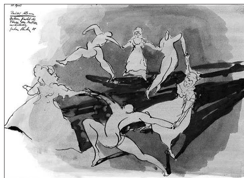
»Watteau findet die Tänze von Matisse merkwürdig«: Kunsthistoriker freuen sich, doch auch der Laie staunt.