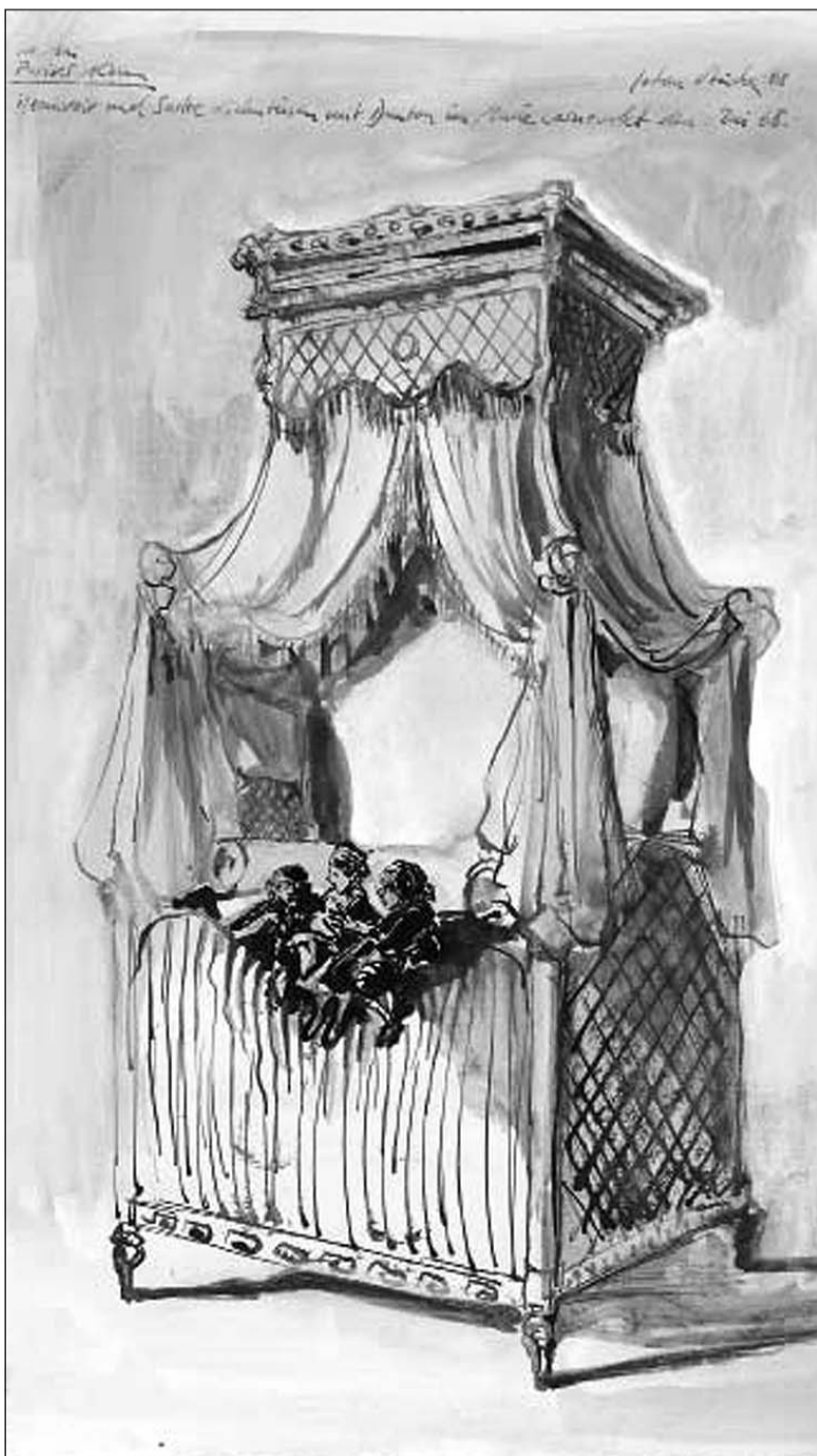
Beauvoir und Sartre diskutieren mit Danton: Anlässlich der Jubiläumsfeierlichkeiten zum Mai 1968 entstand die Idee für diese Tusche-Zeichnung.