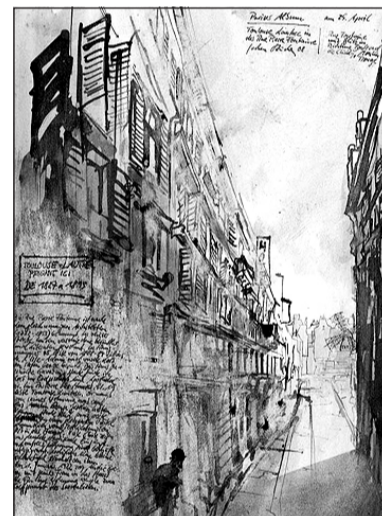
Toulouse-Lautrec (ganz klein) in der Rue Pierre Fontaine.

Zu sehen ist die Ausstellung bis zum 29. März – dienstags bis samstags von 14 bis 18 Uhr und sonntags 11 bis 18 Uhr. Ziemann-Heitkemper bietet ab 1. Februar jeden Sonntag um 15 Uhr Führungen durch die Ausstellung an.