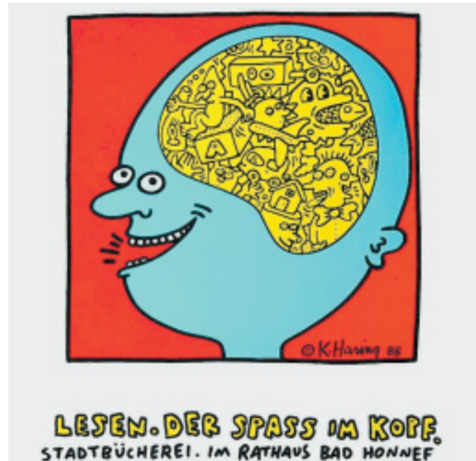
Klare Ansage: Welche Fantasiewelten sich dem Leser beim Schmökern erschließen, kann selbst Haring zeichnerisch nur anreißen.

zum Internationalen Jahr der Jugend. 1985: Plakate für ein freies Südafrika sowie Coverillustrationen für „Scholastic News“. 1986: Wandbilder an der Berliner Mauer und in NY, Eröffnung von Harings Pop Shop in NY und Einzelausstellung im Amsterdamer Stedelijk. 1987: Nach Aids-Befund Engagement bei „Art against AIDS“, bau des Karussells für Hamburgs „Luna Luna“-Vergnügungspark, Teilnahme am „Skulptur Projekt“ Münster. 1989: Druckgrafische Serien Apocalypse und The Valley, Wandbilder in Barcelona und Pisa. Für die UN arbeitet er zum „Stop AIDS Worldwide Year 1990“. 1990: Am 16. Februar stirbt Keith Haring in NY.