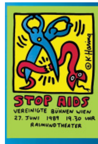
Schnipp: Wenn es doch so einfach wäre, Aids zu stoppen.

Schon im Vorfeld hat die farbenfrohe Plakatschau großes Interesse vor allem in Schulen geweckt. Zahlreiche Kunstlehrer haben sich mit Klassen zum praktischen Arbeiten an den Donnerstagen im Pöppelmann-Haus angemeldet.