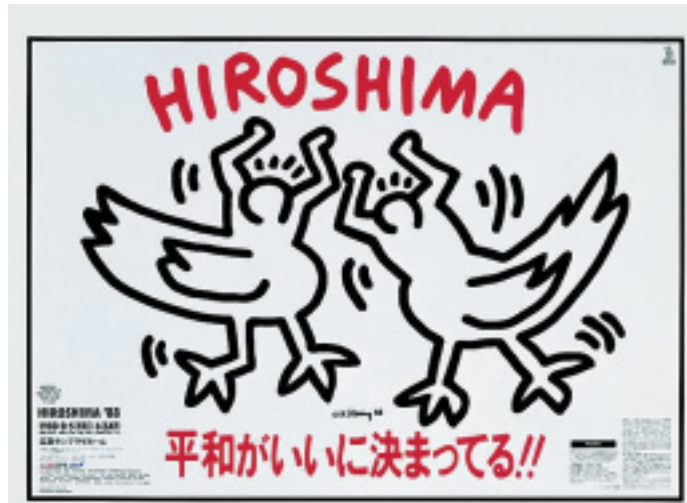
Geschafft: Zwei Taubenmenschen sind froh, in Hiroshima überlebt zu haben. Plakat von 1988 zur Erinnerung an den Atombombenabwurf.