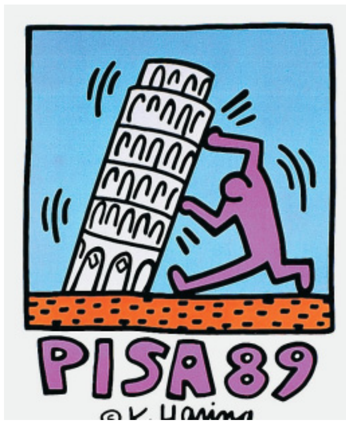
Mit Schmackes: Voller Elan geht das Männchen daran, den weltbekanntesten schiefen Turm von Pisa senkrecht hinzustellen.