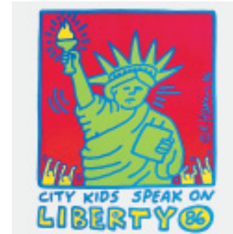
Beim Wort genommen: New Yorks Kinder wollen Freiheit.