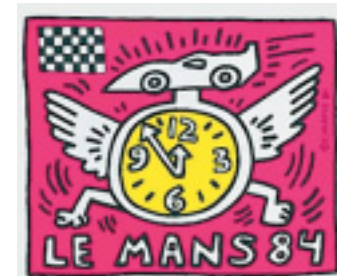
Tempo: Auf die Plätze, fertig – Gas für die Boliden in Le Mans.