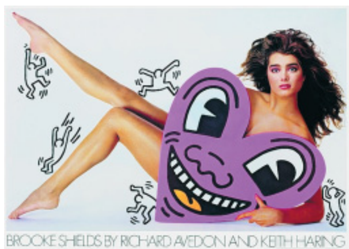
Umschwärmt: Die hingehauchte Brooke Shields war 1985 willkommenes „Lustobjekt“ für Keith Harings fröhlich-freche Strichmännchen.