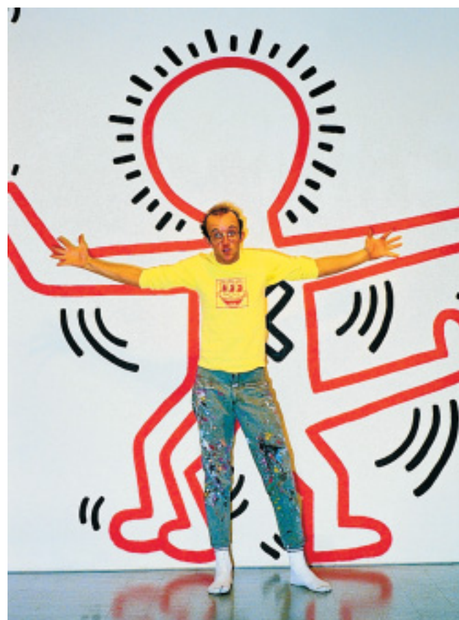
Mehr sind nicht drin: Keith Haring vor einer großen Wandfigur, die – im Gegensatz zu ihm – über vier Beine verfügt.