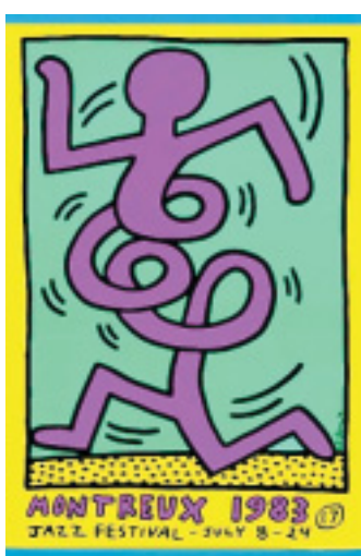
Schwungvoll: Bei den Synkopen des Jazz können sich Tanzende problemlos verheddern.