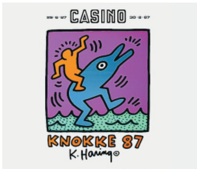
Vorsicht: Der Ritt auf dem Delfin-Mann dürfte ebenso riskant sein wie der Besuch des Casinos von Knokke, wenn man züchtig zocken könnte.