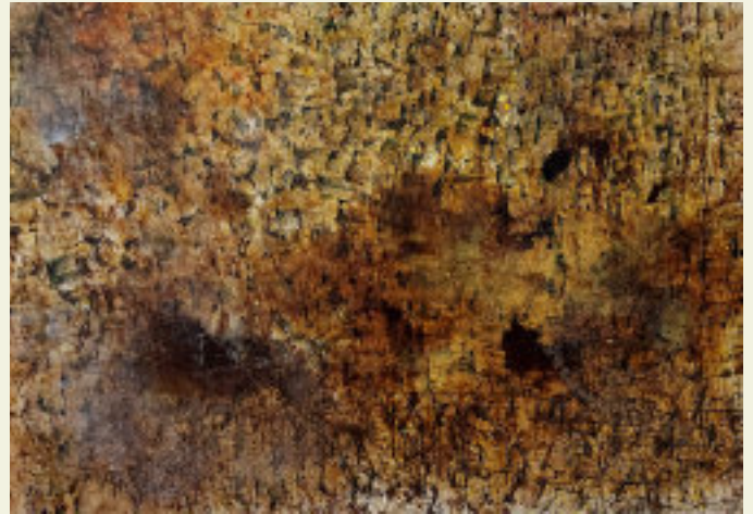
Marek Bieganiak, 2005, Landschaft 2t, 140 x 200 cm-Mischtechnik