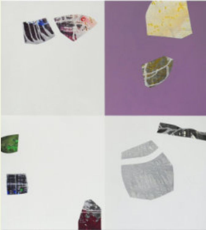
Jobst Tilmann, Hohe Zeit, 190x210, 2020 © Kulturbeutel Herford e.V.

Eine Gemeinschaftsausstellung von Kulturbeutel Herford e.V. und Herforder Kunstverein e.V. Zu sehen sind Malerei, Grafik, Fotografie, Skulptur und Plastik von 9 zeitgenössischen Kunstschaffenden.