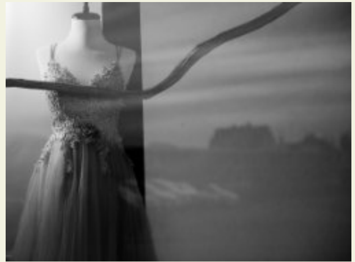
Ralf Bittner, corona diary / mindener strasse