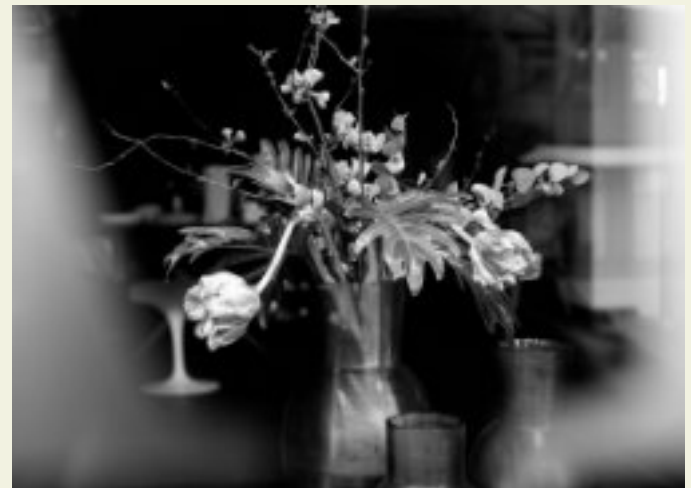
Ralf Bittner, corona diary / zwischenland © Kulturbeutel Herford e.V.